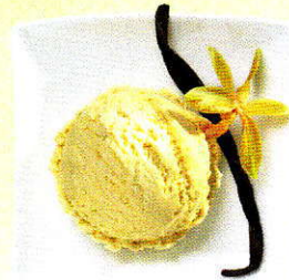
Vanille Rahmglace Vanille