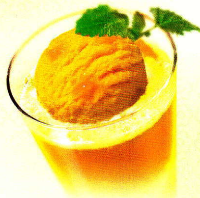
Mangosorbet Frisches Mangosorbet mit Apérol CHF 10.50