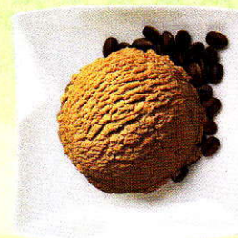
Ice Café Rahmglace