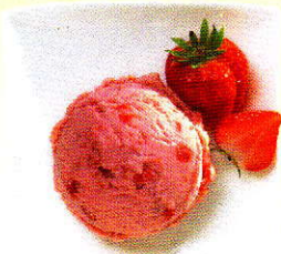
Erdbeer Rahmglace mit Erdbeerstückchen