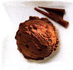
Chocolat Rahmglace mit Schokoladenstückchen