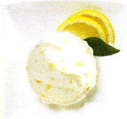
Sorbet Citron Vert Sorbet mit Zitronen-Zesten