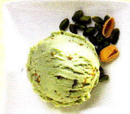
Pistache Rahmglace mit gerösteten Pistazienstückchen