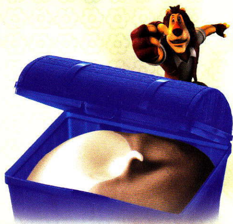
Max Schatztruhe Zum Entdecken und Staunen. Eine Überraschung mit Vanille und Chocolat Glace CHF 5.50