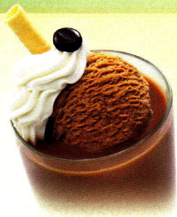
Ice Café Klassischer Ice Café CHF 9.00