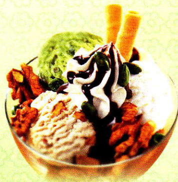
Coupe Casablanca Eine feine Kombination aus den Glacevarianten Pistache, Vanille und Walnuss CHF 10.50