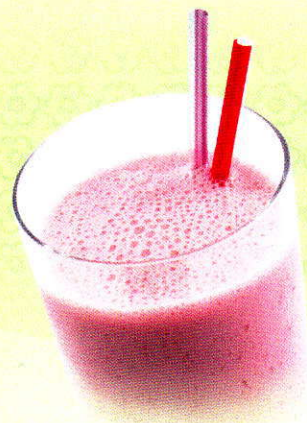
Frappés Geniessen Sie Ihr Frappé mit einem Aroma Ihrer Wahl CHF 7.50