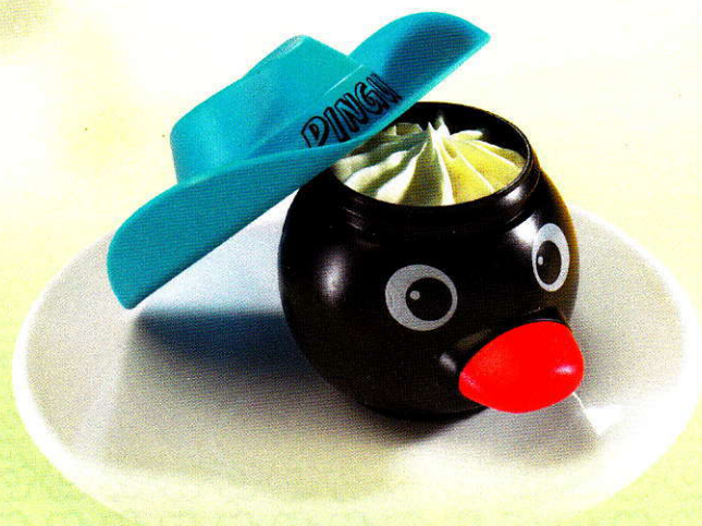
Pingu Wer kennt nicht den lustigen Pingu? Hier gibt es ihn gefüllt mit Vanille Glace CHF 5.50