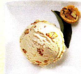
Walnuss Rahmglace mit caramelisierten Walnüssen