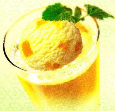
Sorbet Karibik Ein Coupe mit Leidenschaft. Frisches Sorbet Passionsfrucht mit Prosecco CHF 10.50