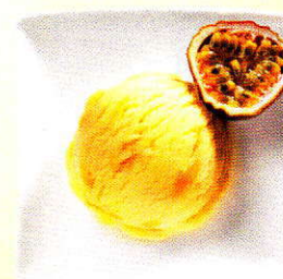
Passionsfruchtsorbet Sorbet mit Maracujasaft und Mangostückchen