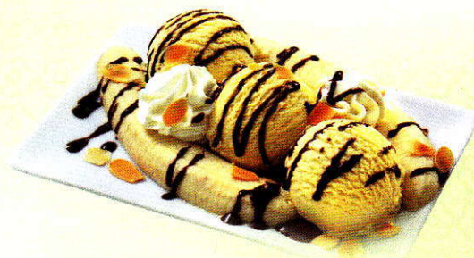
Banana-Split Feines Vanille Glace und Bananenhälften garniert mit Mandelsplittern und Chocosauce CHF 11.00