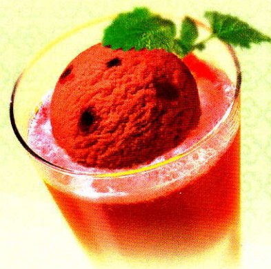
Zwetschgensorbet Fruchtiges Zwetschgensorbet mit Vielle Prune CHF 10.50