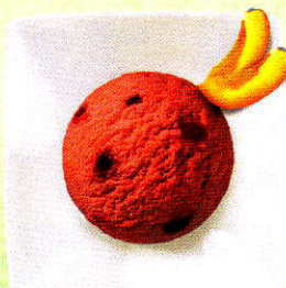
Zwetschgensorbet Sorbet mit Zwetschgenstückchen