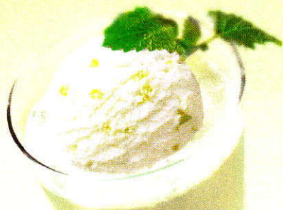
Le Colonel Das frische Citron Vert Sorbet mit kühlem Vodka CHF 10.50